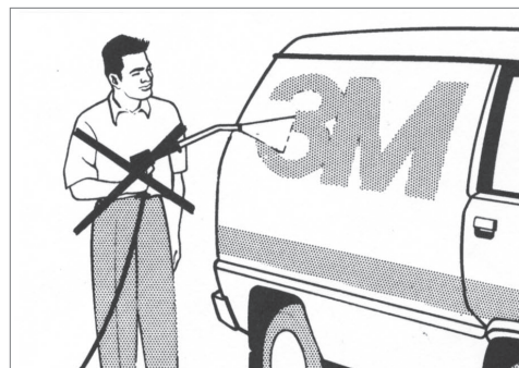
FALSCH: Der Wasserstrahl darf nicht flach auf die Folienkante gerichtet werden.